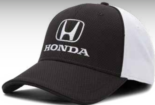
CASQUETTE ÉQUIPE HONDA PERFORMANCE — NOIRE 219224 Casquette 95 % polyester et 5 % coton. Motif de losanges texturés. Devant structuré. Courroie réglable en Velcro®. PDSF 13,50 $