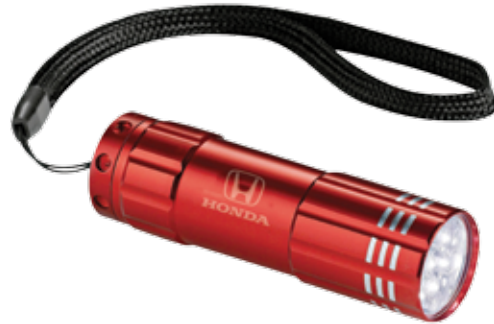
LAMPE DE POCHE À DEL 219273 Bouton marche-arrêt sur la base. Dragonne et trois piles AAA comprises. PDSF 6,00 $