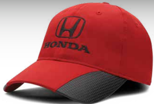
CASQUETTE ORNÉE DE FIBRE DE CARBONE 219221 Casquette 100 % polyester présentant des sections de fibre de carbone sur la visière. Devant structuré. Courroie réglable en Velcro®. PDSF 13,00 $