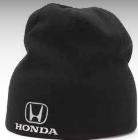
BONNET HONDA PERFORMANCE 215184 Bonnet en jersey 100 % coton. PDSF 7,00 $