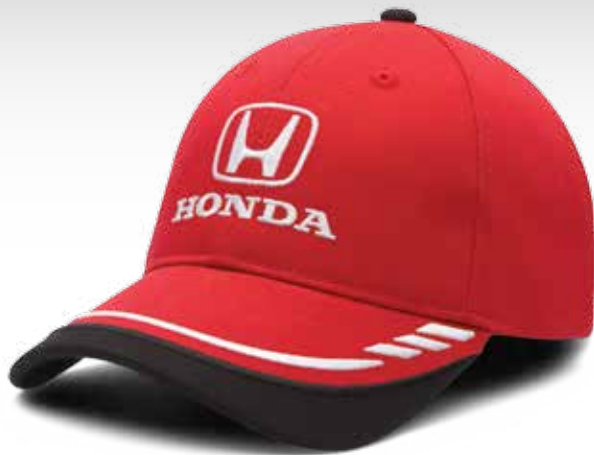
CASQUETTE À VISIÈRE ORNÉE DE TROIS RAYURES 215182 Casquette en croisé 100 % coton à calotte structurée. Bande Velcro® réglable et patte Honda caractéristique au dos. PDSF 9,50 $