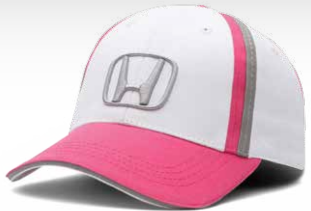
CASQUETTE BELLA POUR FEMME 196763 Casquette en croisé 100 % coton. Courroie arrière réglable en Velcro®. PDSF 10,50 $