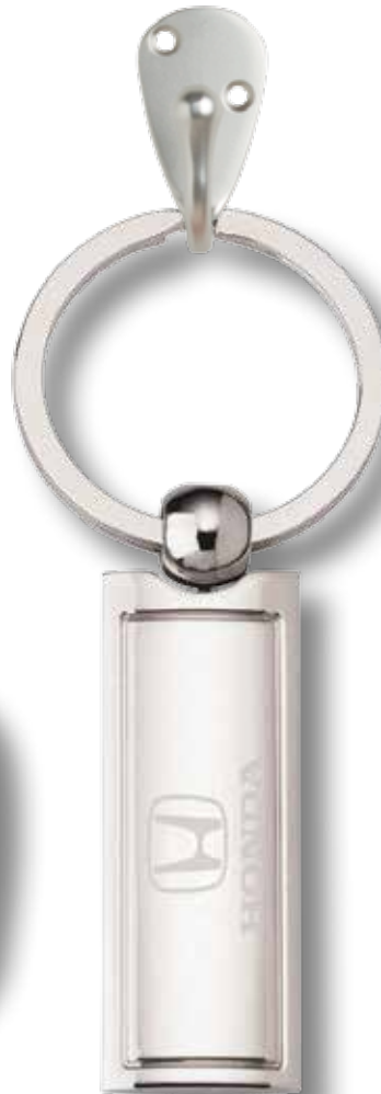
PORTE-CLÉS EN CHROME 155608 Porte-clés en métal à plaque au centre. Dimensions : 1/2 po l x 2 po L. PDSF 5,00 $