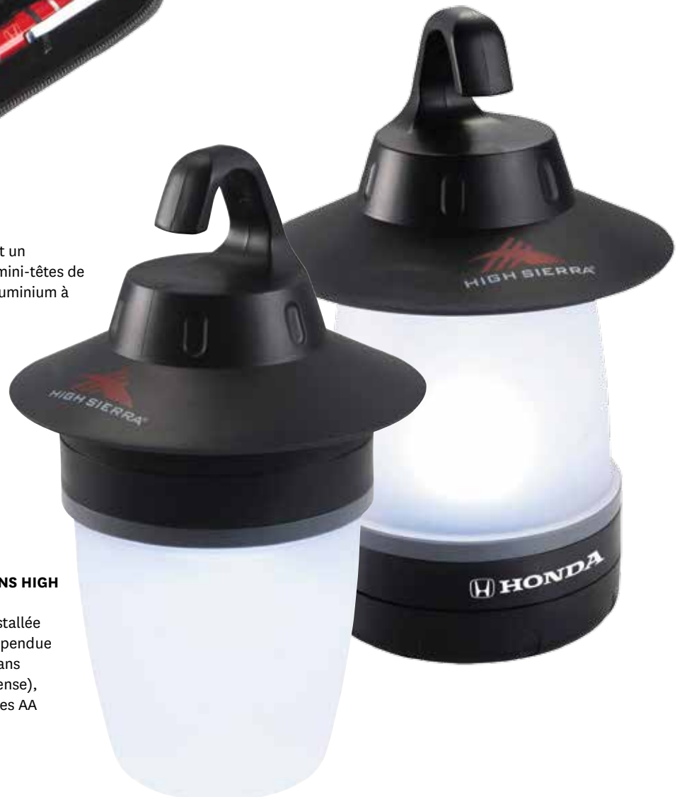
LANTERNE À DEL DEUX FAÇONS HIGH SIERRA® 219293 Lanterne à DEL pouvant être installée de deux façons différentes : suspendue à l'aide du crochet supérieur (sans base pour un éclairage plus intense), ou à plat sur la base. Quatre piles AA comprises. PDSF 11,50 $