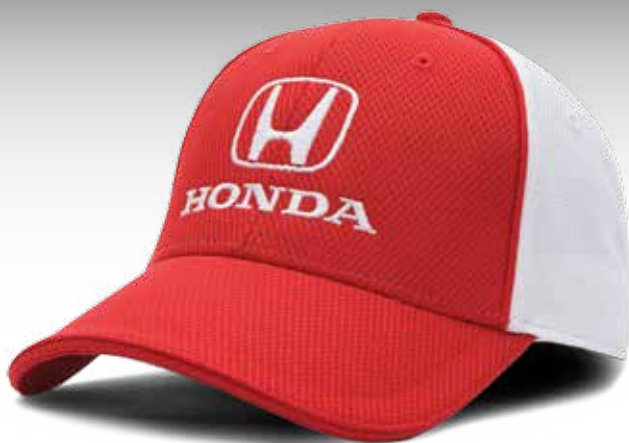
CASQUETTE ÉQUIPE HONDA PERFORMANCE — ROUGE 219222 Casquette 95 % polyester et 5 % coton. Motif de losanges texturés. Devant structuré. Courroie réglable en Velcro®. PDSF 13,50 $