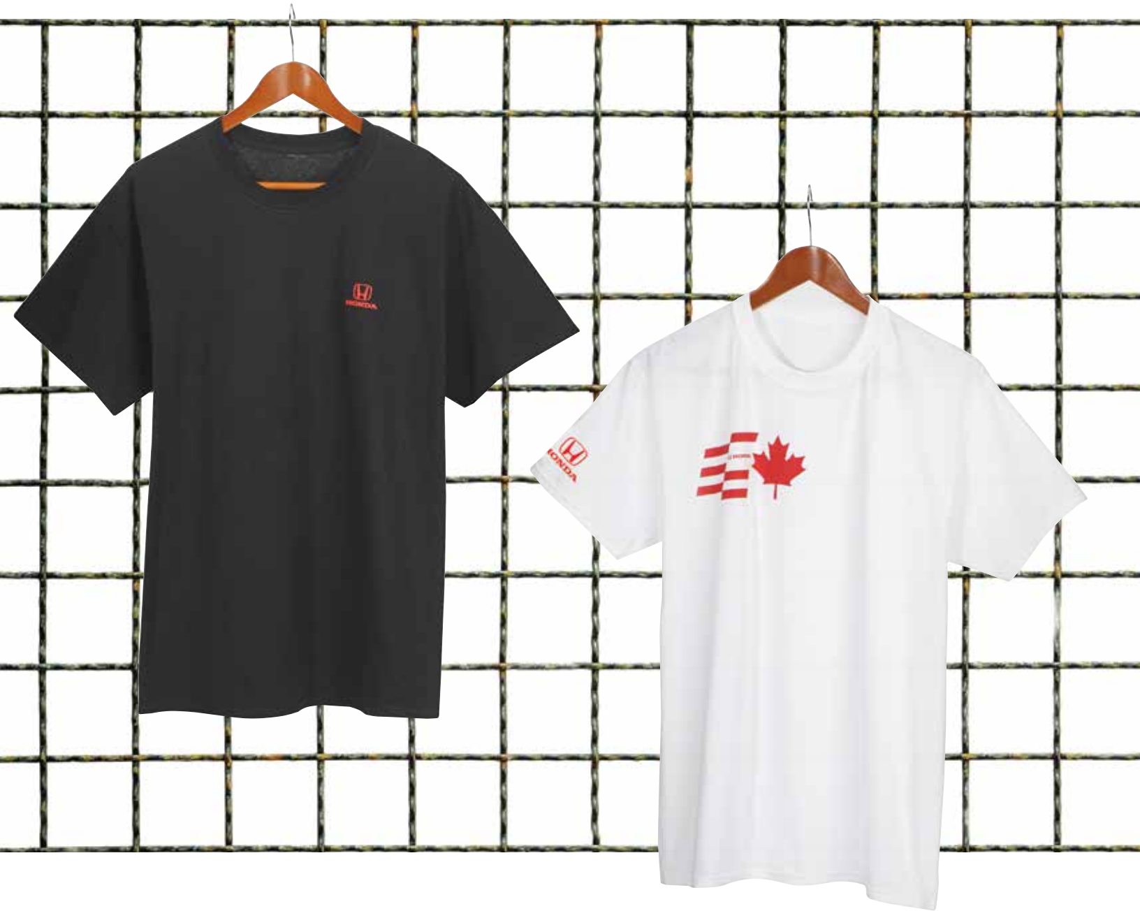
TEE-SHIRT HONDA CLASSIQUE 219196 Pur coton. M-TG PDSF 10,50 $