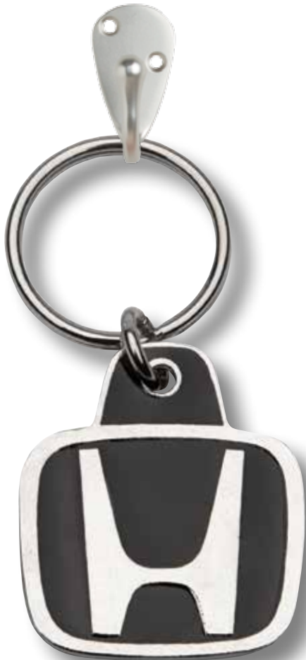
PORTE-CLÉS HONDA 196833 Porte-clés personnalisé en nickel au fini argent et noir brillant. Dimensions : 1,1 po l x 1 po 3/8 L. PDSF 5,00 $