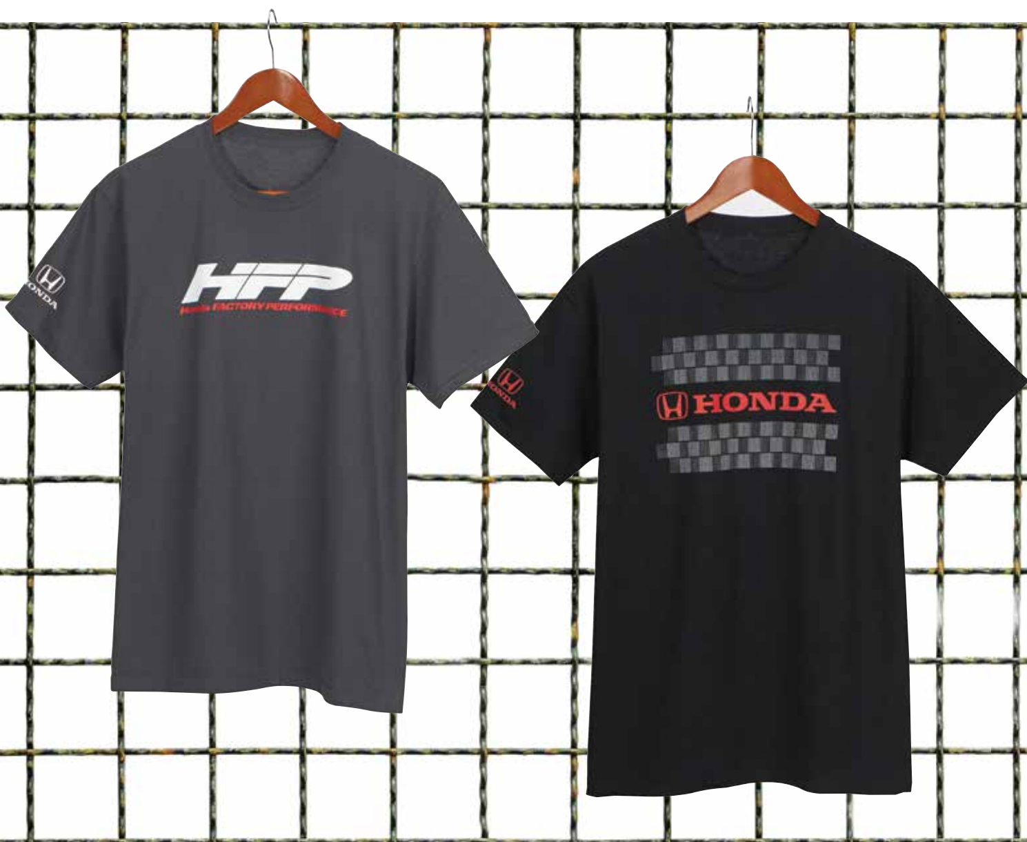
TEE-SHIRT HFP 219202 Pur coton. M-TG PDSF 10,50 $