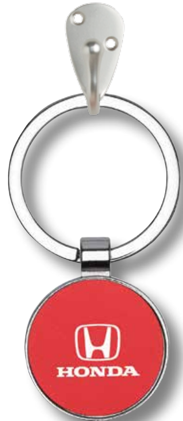
PORTE-CLÉS ROND (PAQUET DE 2) 219260 Porte-clés en métal présentant une plaque centrale métallique au fini mat, des garnitures chromées et un anneau brisé. Dimensions : 1 po 1/8 de largeur. PDSF 7,00 $