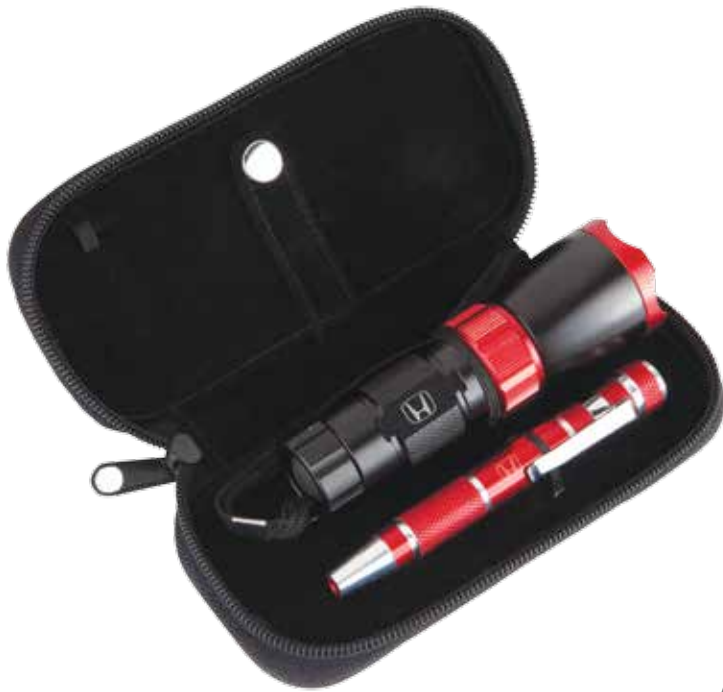
TROUSSE DE RÉPARATION 219274 Pochette à glissière pratique contenant un tournevis en métal de type stylo, huit mini-têtes de tournevis et une lampe de poche en aluminium à DEL. Trois piles AAA comprises. PDSF 17,50 $