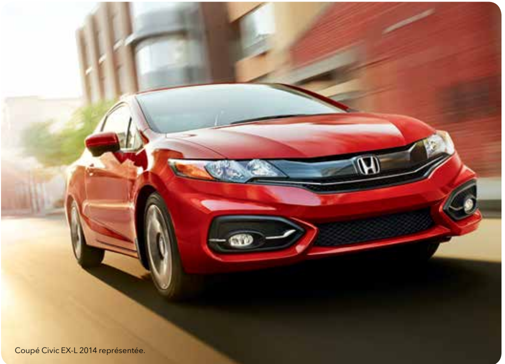
Coupé Civic EX-L 2014 représentée.