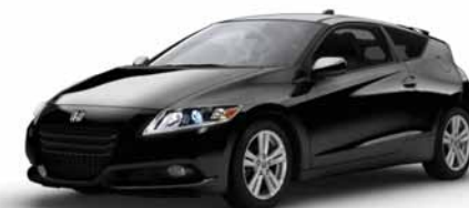
CR-Z ENSEMBLE PREMIUM