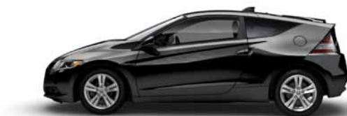
CR-Z ENSEMBLE PREMIUM