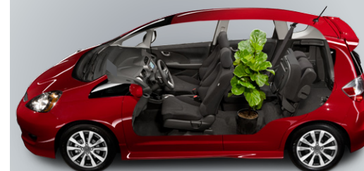
Modèle américain représenté.