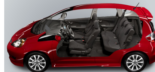
Modèle américain représenté.