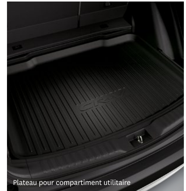
Plateau pour compartiment utilitaire