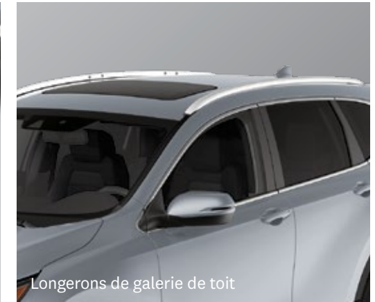
Longerons de galerie de toit