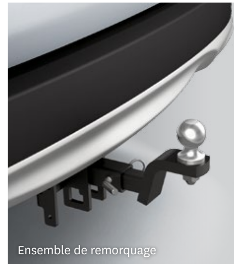
Ensemble de remorquage