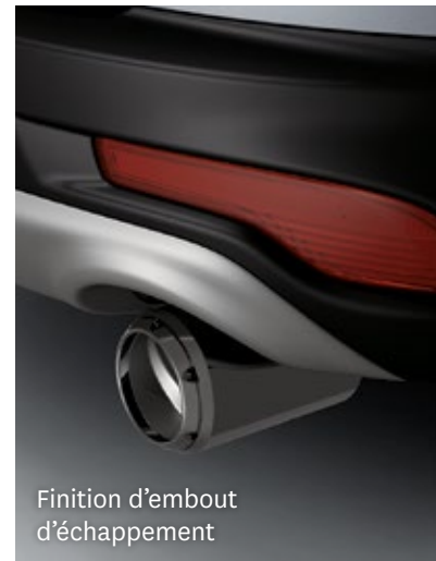
Finition d'embout d'échappement