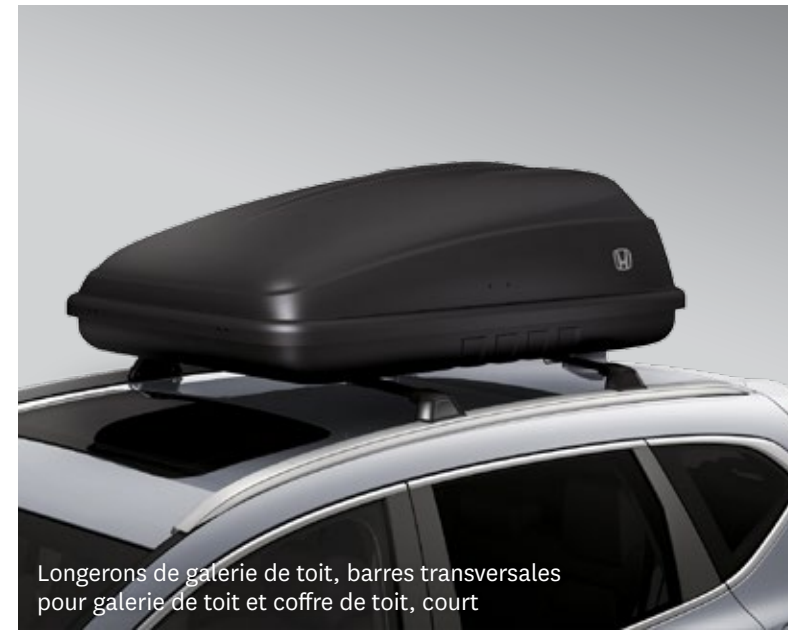
Longerons de galerie de toit, barres transversales pour galerie de toit et coffre de toit, court