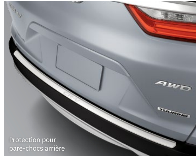
Protection pour pare-chocs arrière