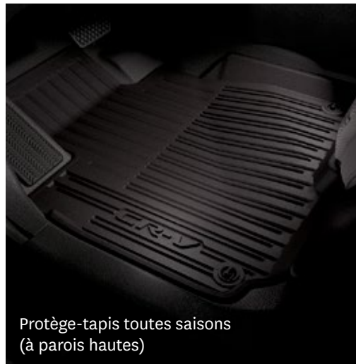
Protège-tapis toutes saisons (à parois hautes)