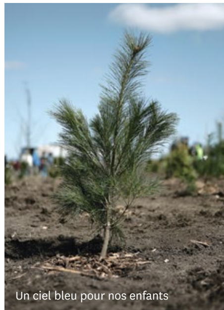
Un ciel bleu pour nos enfants