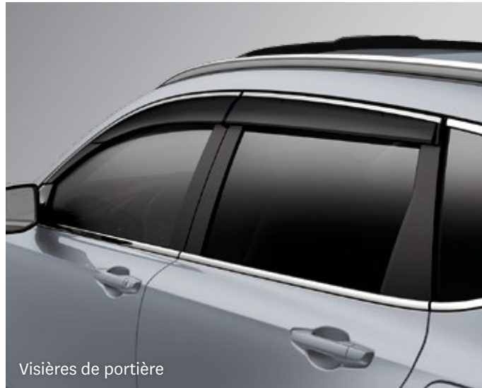
Visières de portière