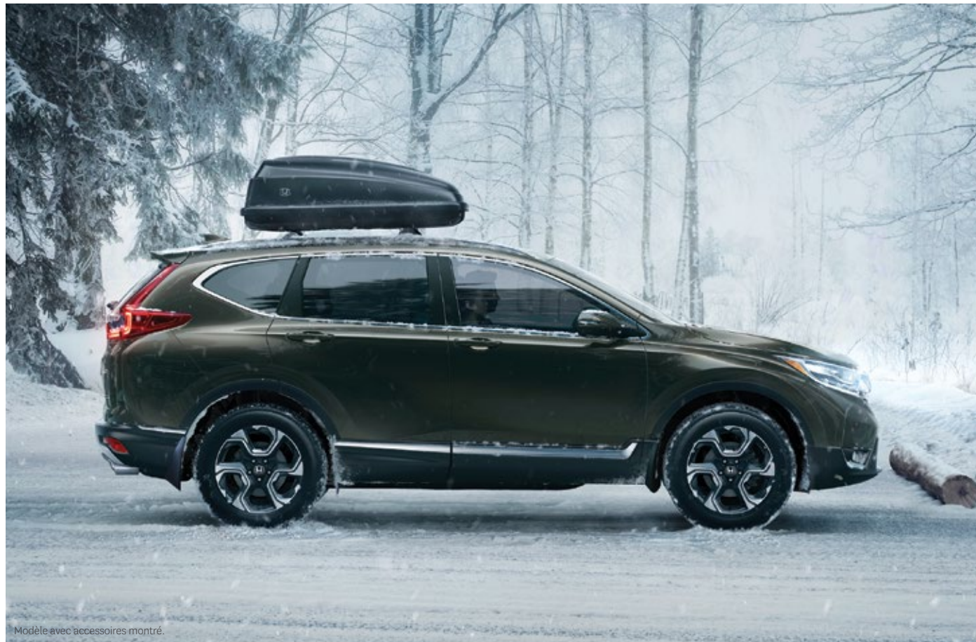
Modèle avec accessoires montré.