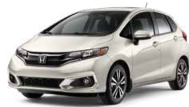
Blanc platine nacré