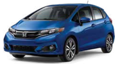
Bleu égéen métallisé