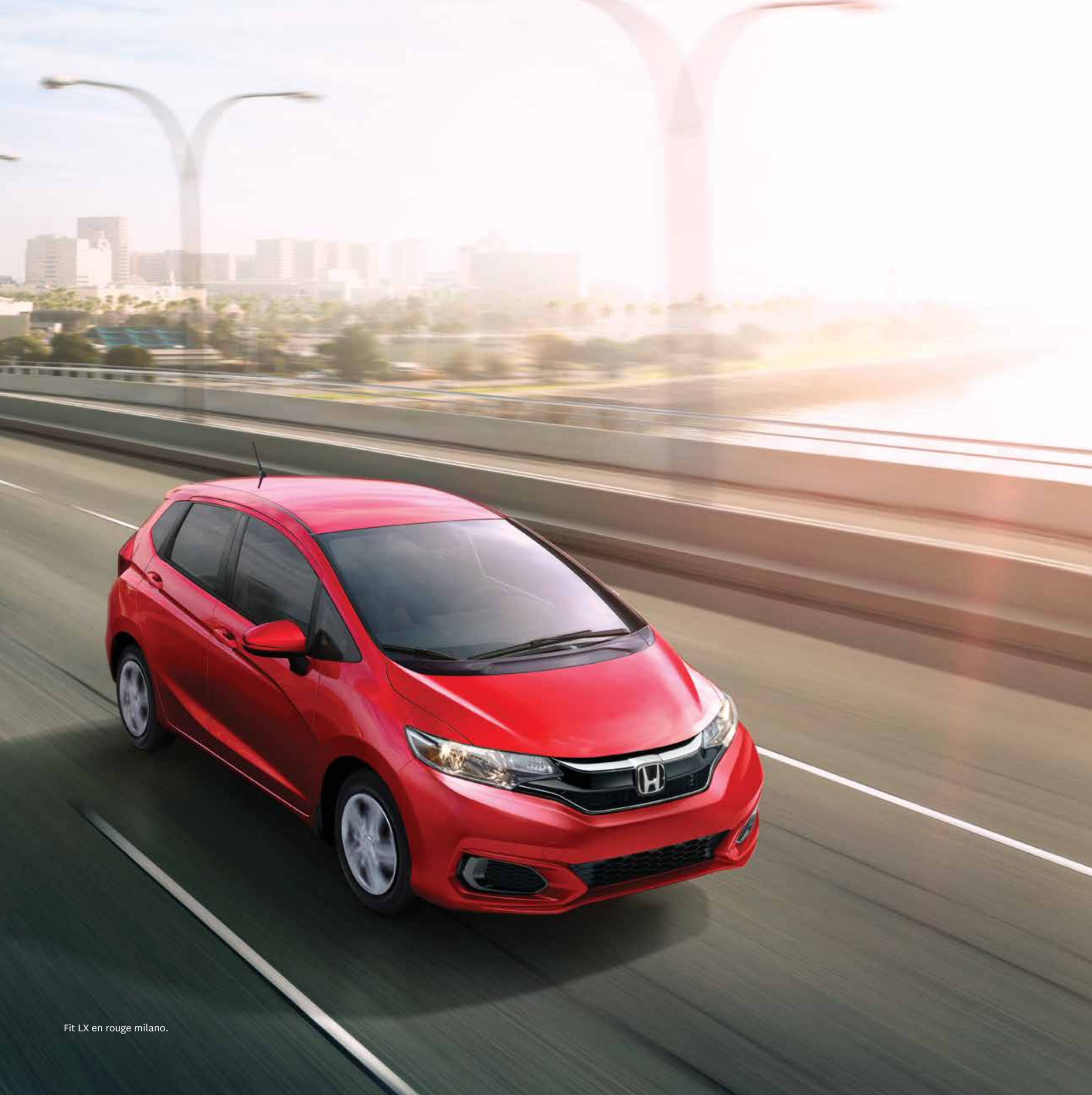
Fit LX en rouge milano.