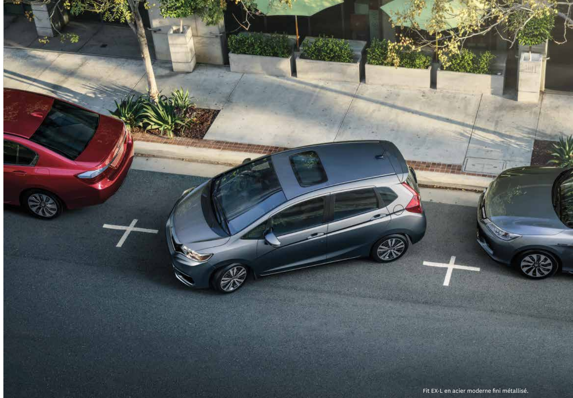
Fit EX-L en acier moderne fini métallisé.

1. Aucune des caractéristiques décrites ne vise à remplacer la responsabilité du conducteur à faire preuve d'une grande prudence lorsqu'il conduit. Les conducteurs ne devraient pas tenir en main des appareils ou manipuler certaines fonctions du véhicule à moins qu'ils puissent le faire de manière légale et sécuritaire. Certaines caractéristiques présentent des limites technologiques. Pour des renseignements, limites et restrictions supplémentaires sur nos caractéristiques, veuillez visiter le www.honda.ca/desistement et consulter le manuel du propriétaire de votre véhicule.