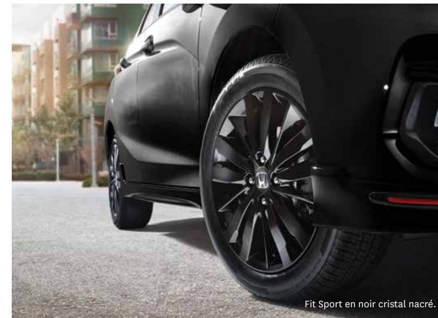
Fit Sport en noir cristal nacré.