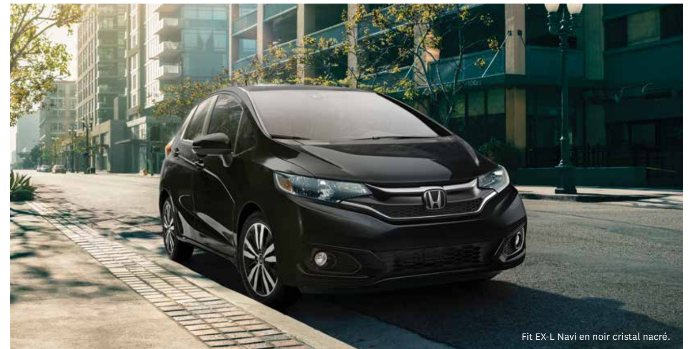
Fit EX-L Navi en noir cristal nacré.