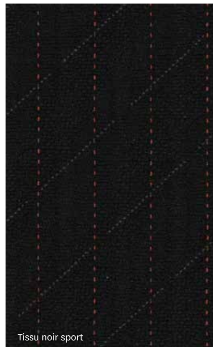
Tissu noir sport