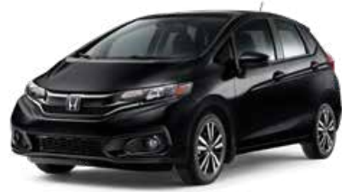
Noir cristal nacré