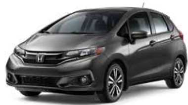
Acier moderne fini métallisé