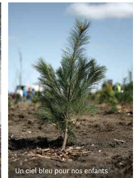
Un ciel bleu pour nos enfants