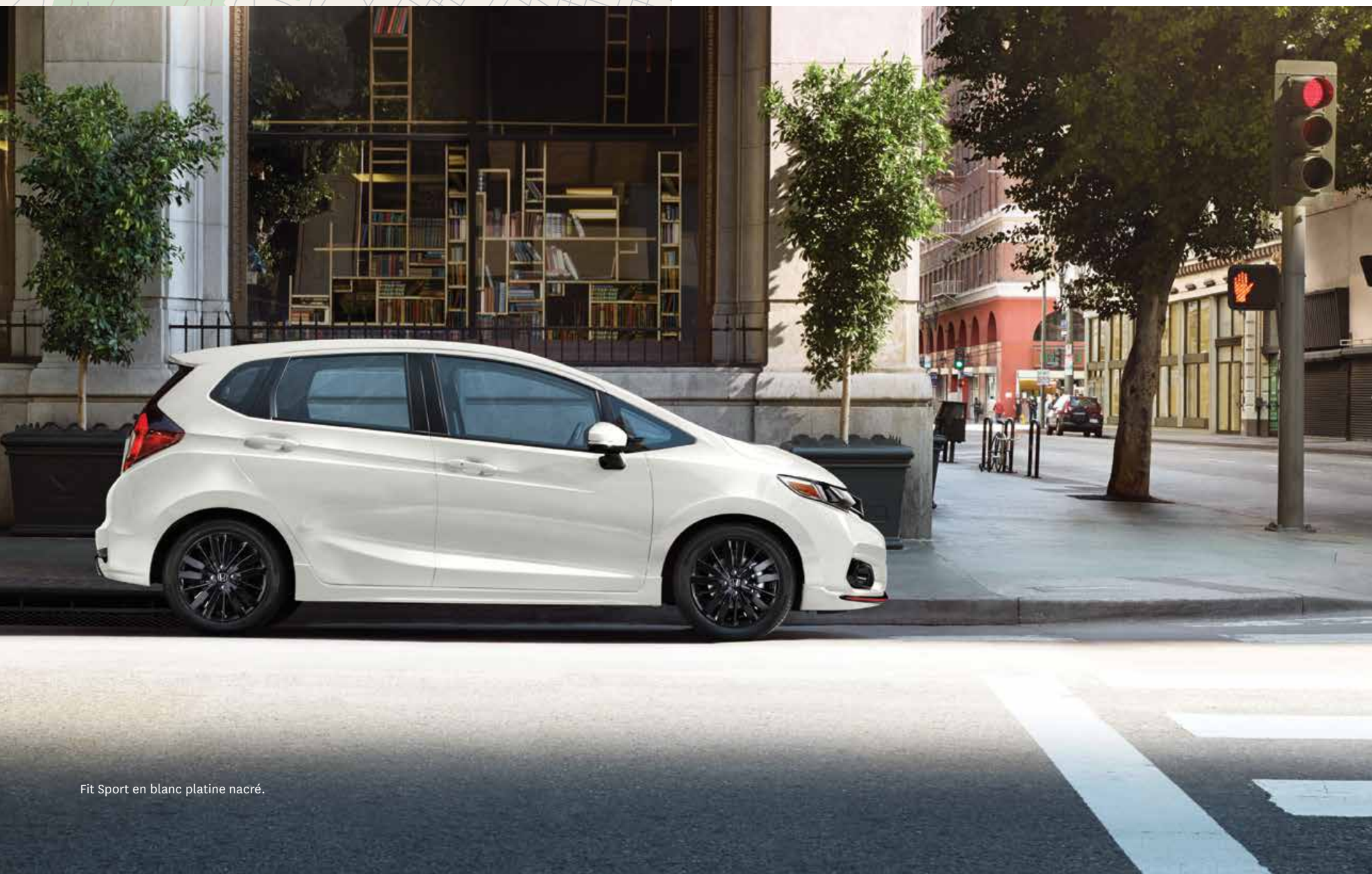
Fit Sport en blanc platine nacré.